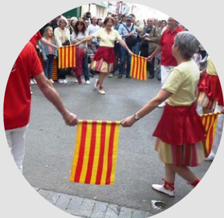
LES CIRERES La colla sardanista del Vallespir

A la plaça hi han sardanes quines ganes de ballar ! A la plaça hi han sardanes mare deixeu-mi anar. Sents ? ja ens crida la tenora i refila el flabiol au ! anem -hi que ja es hora i no hi vulguis anar sol. Vine, vine amb mi i escolta les paraules que et vull dir Puntejant poc a poquet i estrenyent la teva mà es mes dolça l'esperança de que tu m'estimaràs. Puntejant poc a poquet vaig, parlant - te de l'amor i els compassos de la dansa van seguint el nostre cor. Mentre la cobla alegrement els "llargs" airosos llença al vent A la plaça hi han sardanes amor i vida t'ofereiré, ballarem nostra sardana les mans unides i els cors també.